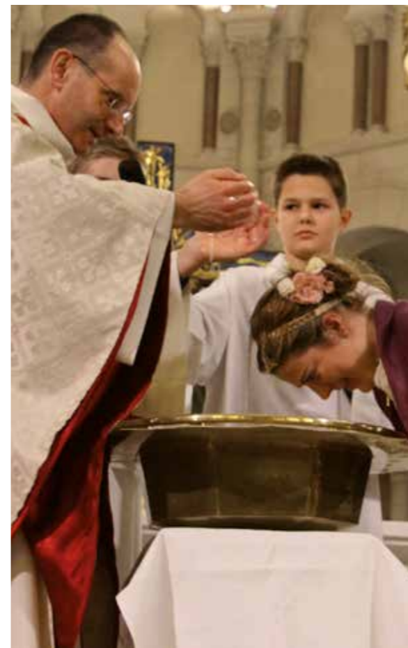
Baptême d'adulte - Église Saint-Pierre

Un tel temps fort devrait être un tremplin pour développer sa vie de foi, un temps d' évangélisation dans la rencontre, d'annonce de l'Évangile à ceux qui ne le connaissent pas ou peu, d'invitation à découvrir ou partager la prière et la louange de l'Église. Il devrait permettre aux paroissiens d'aller plus loin dans leur mission de disciple-missionnaire et de développer leur audace et leur capacité à témoigner de leur foi, ainsi qu'attirer de nouveaux paroissiens par des propositions différenciées et créatrices d'unité.