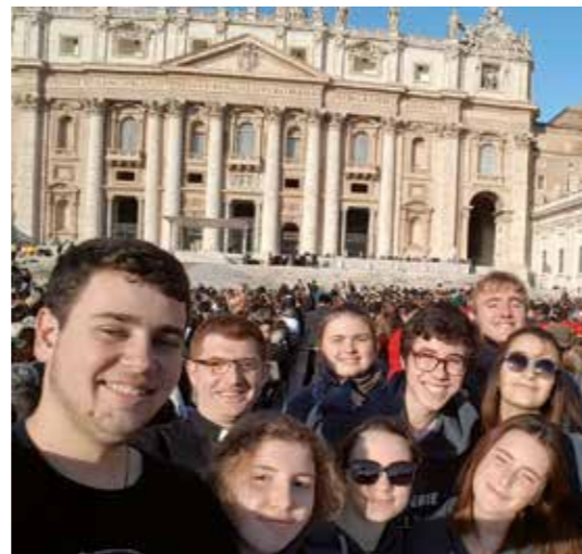
Pèlerinage à Rome 2018

« Ce qui fait la gloire de mon Père, c'est que vous portiez beaucoup de fruit et que vous soyez pour moi des disciples. » Jn 15, 8