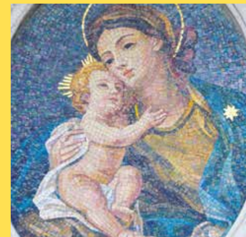
Place Farnèse - Rome

Demandons à l'Esprit Saint de nous éclairer et nous fortifier pour vivre les conversions nécessaires, personnelles et communautaires, dans la joie d'annoncer la Bonne Nouvelle : « Christ est ressuscité ! Il est vraiment ressuscité ! »